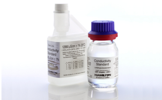
【ハミルトン デュラケル高精度導電率標準液】