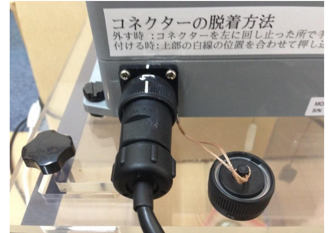
②比重センサーに専用ケーブルを接続