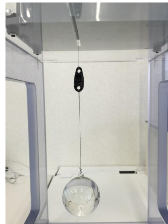
④吊り糸連結部の取付