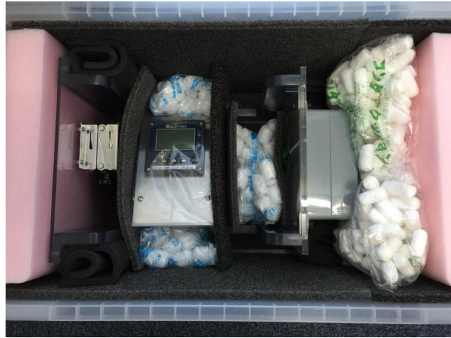
①梱包箱から比重計一式を取り出す