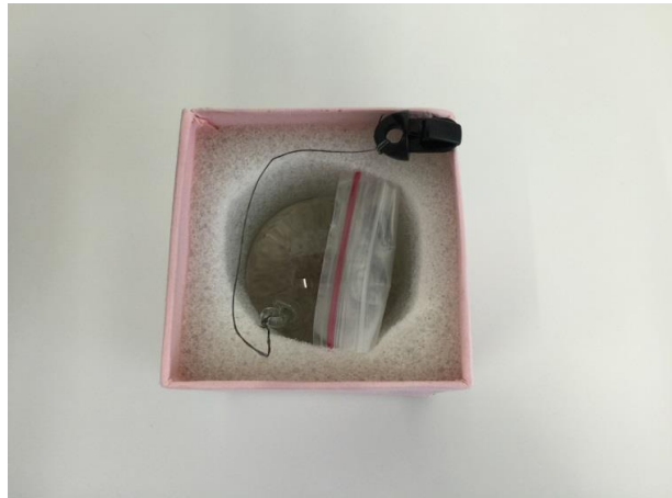
③ガラス玉を用意する